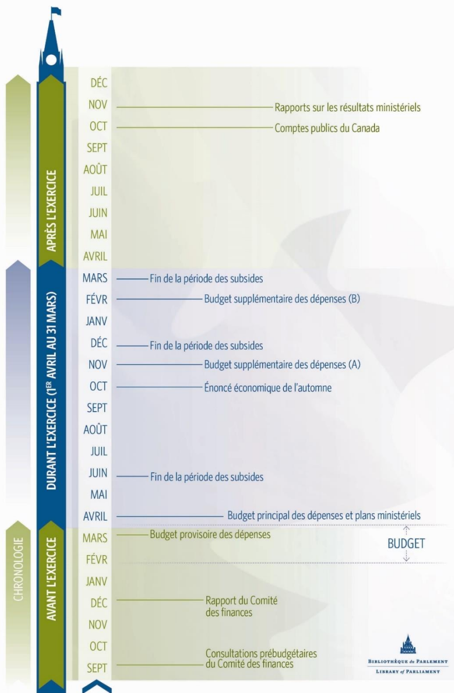
Figure 1 — Le cycle financier parlementaire